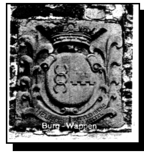
Abbildung 2 Burg-Wappen